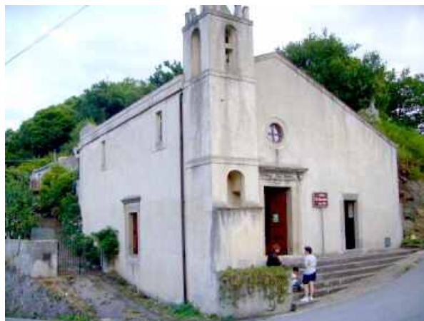
La Chiesa dell'Annunziata

Santi greci portarono questo nome), lungo il Timeto, oltre ad altri toponimi di chiara derivazione greca sul territorio. Non vi sono date precise, ma con ogni probabilità l'origine di S. Piero è molto più antica del periodo arabo cui di solito si fa risalire.