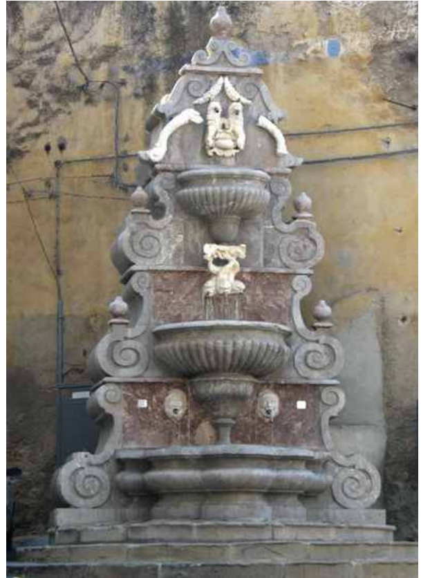
La fontana di Santo Vito

Tra le memorie più belle che adornano il centro di San Piero Patti ci sono le fontane, a cominciare dalla barocca marmorea "Fontana di Santo Vito", raffinata ed elegante, che fu costruita nel 1686 con i favori del barone